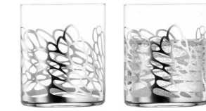
← 2 BECHER 2 TUMBLER in Geschenkröhre / gift tube 791.569.91 430 ml / 14.5 oz 94 mm / 3.7 in 569/9 net GR 737/404