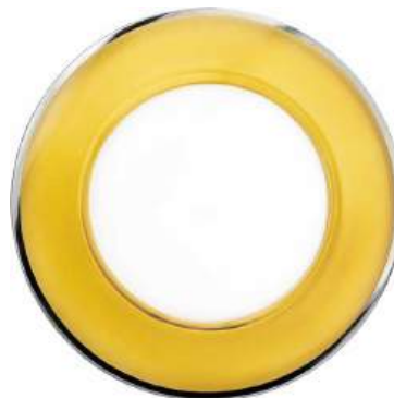
← TELLER PLATE im Geschenkkarton / in gift box 790.516.33 Ø 320 mm / 12.6 in 516/32 amber 729/004