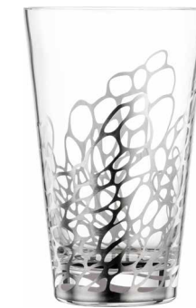
↑ VASE im Geschenkkarton / in gift box 791.651.21 210 mm / 8.3 in Ø 133 mm / 5.2 in 651/21 net 749/904