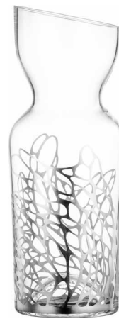
↑ KARAFFE CARAFE im Geschenkkarton / in gift box NO DROP EFFEKT 791.843.10 1 ltr / 33.8 oz 280 mm / 11 in 843/1,0 net 752/504