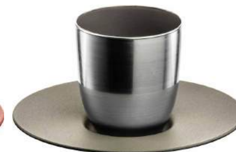
↑ ESPRESSO Mit Untertasse / with saucer in Geschenkröhre / in gift tube 705.109.21 100 ml / 3.4 oz 65 mm / 2.6 in Ø 115 mm / 4.5 in 109/6 cosmo silver-mocca 721/004