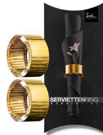
← 2 SERVIETTENRINGE 2 NAPKINRINGS im Geschenkkarton / in gift box 792.905.51 24 mm / 0.9 in Ø 50 mm / 2.0 in 905/50 gold 742/004