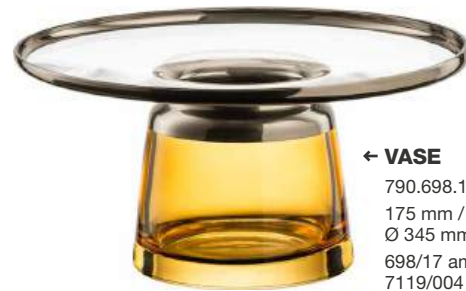
← VASE 790.698.18 175 mm / 6.9 in Ø 345 mm / 13.6 in 698/17 amber 7119/004