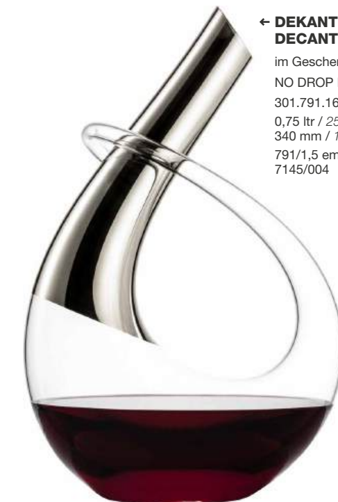
← DEKANTER DECANTER

im Geschenkkarton / in gift box NO DROP EFFEKT 301.755.16 0,75 ltr / 25.4 oz 217 mm / 8.5 in 755/1,5 celebration platinum 786/004