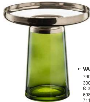
← VASE 790.698.30 300 mm / 11.8 in Ø 290 mm / 11.4 in 698/30 green 7119/004

Die mundgeblasenen Vasen Liv sind die perfekte Symbiose aus zeitgenössischem Design und zeitloser Eleganz. Echtes Platin, in Handarbeit aufgetragen, macht die Design-Objekte zu exklusiven Statement-Pieces für alle, die das Besondere lieben und schätzen. Ergänzt werden die Centrepieces mit den passenden Tellern, um einer Tafel einen hocheleganten und harmonischen Look zu verleihen. Handwäsche