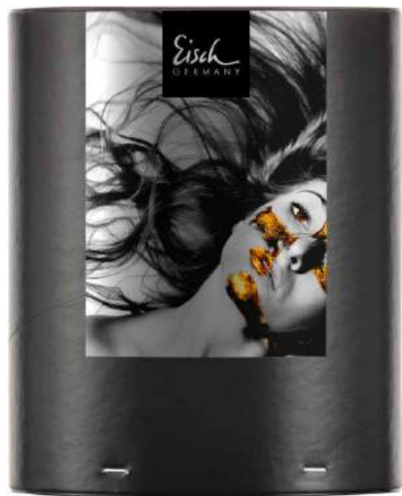
↑ GESCHENKRÖHRE GIFT TUBE