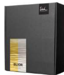
GESCHENKKARTON "FESTIVITY" GIFT BOX "FESTIVITY"

792.543.73 400 ml / 13.5 oz 242 mm / 9.5 in 543/7 platin 756/004