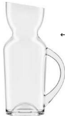
← KRUG JUG

im Geschenkkarton / in gift box NO DROP EFFEKT 301.843.11 1 ltr / 33.8 oz 280 mm / 11 in 843/1,0 lyn platinum 767/504