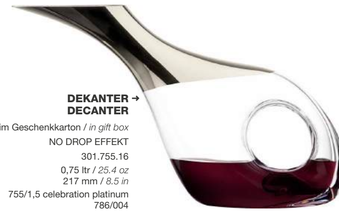
→ DEKANTER DECANTER

The Celebration and Embrace platinum decanters are masterpieces for wine enthusiasts. The exclusive decanters are mouth-blown from brilliant, lead-free crystal and hand-coated with platinum. All precious metals are sealed using the Eisch GPC® protect technology. Handwash