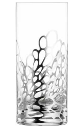
← LONGDRINK 791.500.13 470 ml / 15.9 oz 161 mm / 6.3 in 500/13 net 718/304