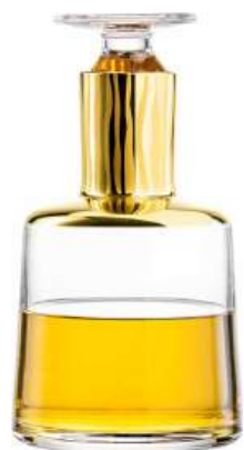
← WHISKYKARAFFE WHISKY CARAFE im Geschenkkarton / in gift box 792.899.08 750 ml / 25.4 oz 220 mm / 8.7 in 899/0,75 gold 783/004