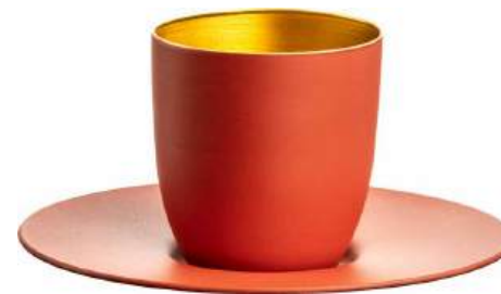
↑ ESPRESSO Mit Untertasse / with saucer in Geschenkröhre / in gift tube 705.109.15 100 ml / 3.4 oz 65 mm / 2.6 in Ø 115 mm / 4.5 in 109/6 cosmo gold-coral 718/904