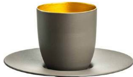
← ESPRESSO Mit Untertasse / with saucer in Geschenkröhre / in gift tube 705.109.16 100 ml / 3.4 oz 65 mm / 2.6 in Ø 115 mm / 4.5 in 109/6 cosmo gold-mocca 718/904