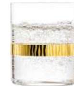
← BECHER TUMBLER 792.569.90 430 ml / 14.5 oz 94 mm / 3.7 in 569/9 elior gold 718/504

Weingläser der Serie Elior finden Sie ab Seite 4. Elior wine glasses from page 4.