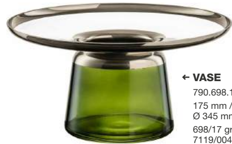
← VASE 790.698.17 175 mm / 6.9 in Ø 345 mm / 13.6 in 698/17 green 7119/004