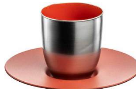
↑ ESPRESSO Mit Untertasse / with saucer in Geschenkröhre / in gift tube 705.109.19 100 ml / 3.4 oz 65 mm / 2.6 in Ø 115 mm / 4.5 in 109/6 cosmo silver-coral 721/004