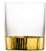
← WHISKY 792.551.14 320 ml / 10.8 oz 88 mm / 3.5 in 551/14 elior gold 718/504

1,5l 50.7 oz 0,75l 25.04 oz INFO Für 0,75 l und für Magnum geeignet Suitable for both 25.4 oz and a magnum bottle