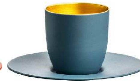
↑ ESPRESSO Mit Untertasse / with saucer in Geschenkröhre / in gift tube 705.109.17 100 ml / 3.4 oz 65 mm / 2.6 in Ø 115 mm / 4.5 in 109/6 cosmo gold-petrol 718/904