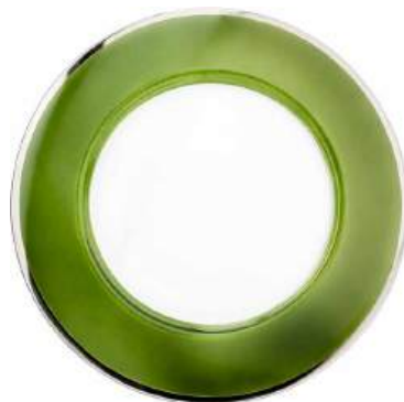
← TELLER PLATE im Geschenkkarton / in gift box 790.516.32 Ø 320 mm / 12.6 in 516/32 green 729/004