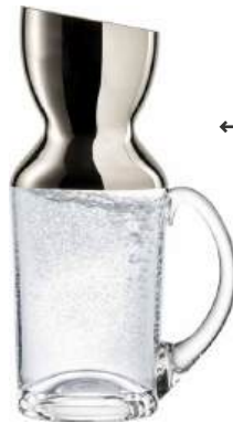
← KRUG JUG

im Geschenkkarton / in gift box NO DROP EFFEKT 301.616.10 1 ltr / 33.8 oz 280 mm / 11 in 616/1,0 lyn 742/004