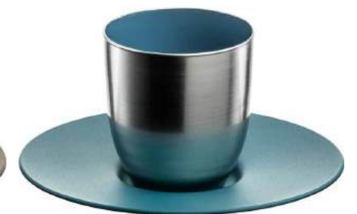
↑ ESPRESSO Mit Untertasse / with saucer in Geschenkröhre / in gift tube 705.109.22 100 ml / 3.4 oz 65 mm / 2.6 in Ø 115 mm / 4.5 in 109/6 cosmo silver-petrol 721/004