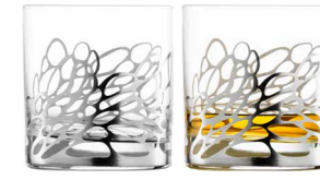
← 2 WHISKYBECHER 2 WHISKY TUMBLERS in Geschenkröhre / gift tube 791.500.15 400 ml / 13.5 oz 95 mm / 3.7 in 500/14 net GR 737/404