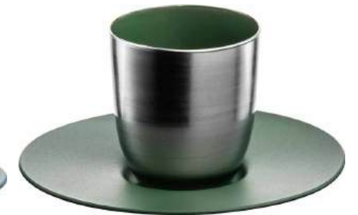
↑ ESPRESSO Mit Untertasse / with saucer in Geschenkröhre / in gift tube 705.109.18 100 ml / 3.4 oz 65 mm / 2.6 in Ø 115 mm / 4.5 in 109/6 cosmo silver-green 721/004