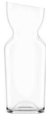
← KARAFFE CARAFE

The mouth-blown carafes and jugs Lyn and Celebration set the tone on the table. Shiny platinum, applied by hand, lends elegance to the carafes and jugs. The EISCH NO DROP EFFEKT guarantees drip-free pouring. Hand wash