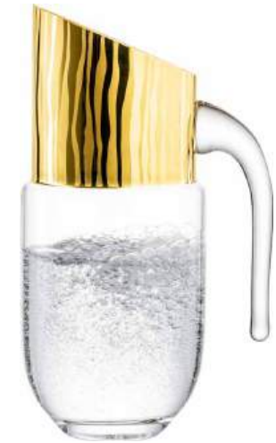
← KRUG JUG im Geschenkkarton / in gift box NO DROP EFFEKT 792.603.15 1,5 ltr / 50.7 oz 270 mm / 10.6 in 603/1,5 gold 768/504