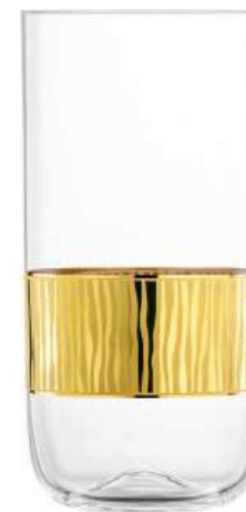
← VASE im Geschenkkarton / in gift box 792.489.25 250 mm / 7.8 in Ø 125 / 4.9 in 489/25 gold 756/004