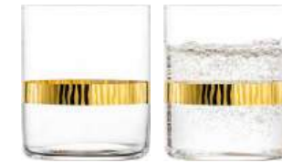
← 2 BECHER 2 TUMBLER in Geschenkröhre / gift tube 792.569.91 430 ml / 14.5 oz 94 mm / 3.7 in 569/9 gold GK 737/504