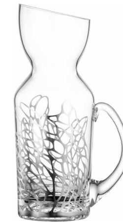
↑ KRUG JUG im Geschenkkarton / in gift box NO DROP EFFEKT 791.616.10 1 ltr / 33.8 oz 280 mm / 11 in 616/1,0 net 762/504