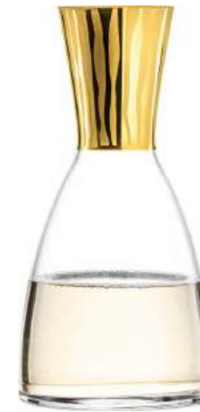
← KARAFFE CARAFE im Geschenkkarton / in gift box NO DROP EFFEKT 792.731.10 0,75 ltr / 25.4 oz 250 mm / 9.8 in 731/1 gold 759/204