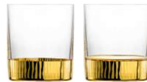
← 2 WHISKYGLÄSER 2 WHISKY GLASSES in Geschenkröhre / gift tube 792.551.15 320 ml / 10.8 oz 88 mm / 3.5 in 551/14 gold GK 737/504