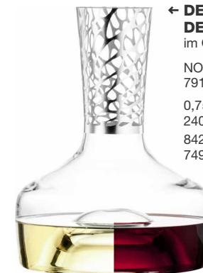
← DEKANTER DECANTER im Geschenkkarton / in gift box NO DROP EFFEKT 791.842.15 0,75 ltr / 25.4 oz 240 mm / 9.5 in 842/1,5 net 749/904