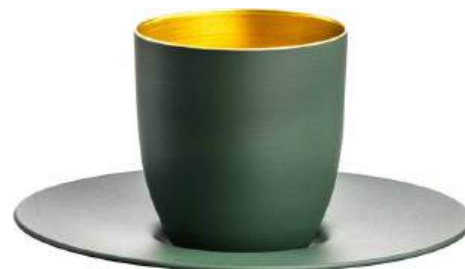
← ESPRESSO Mit Untertasse / with saucer in Geschenkröhre / in gift tube 705.109.14 100 ml / 3.4 oz 65 mm / 2.6 in Ø 115 mm / 4.5 in 109/6 cosmo gold-green 718/904