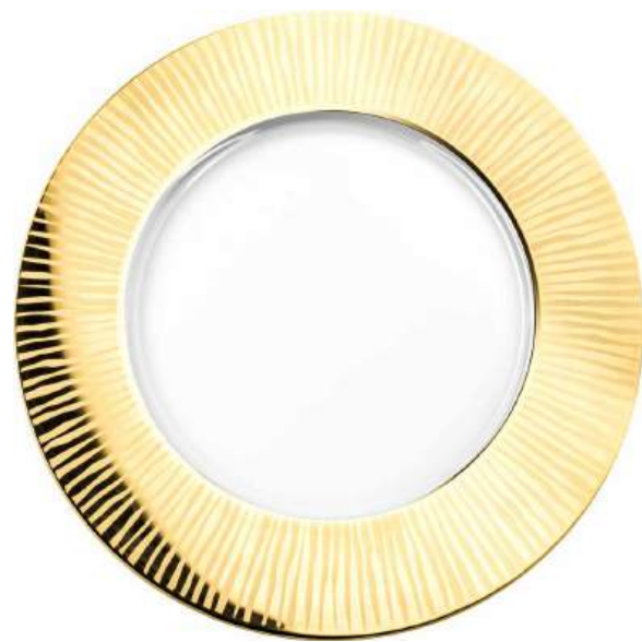
← TELLER PLATE im Geschenkkarton / in gift box 792.516.32 Ø 320 mm / 12.6 in 516/32 gold 766/004

The exquisite Elior gold and platinum series brings the sun into every room in a sophisticated way. The artful alternation between matt and shiny rays creates lively reflections that lend the interior a luxurious touch. The mouth-blown Elior items are elaborately hand-finished with 24-carat gold and platinum. Handwash