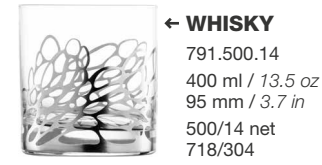
← WHISKY 791.500.14 400 ml / 13.5 oz 95 mm / 3.7 in 500/14 net 718/304