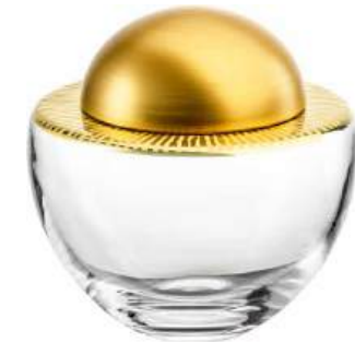
← DOSE CANDY BOX im Geschenkkarton / in gift box 792.371.17 171 mm / 6.7 in Ø 171 mm / 6.7 in 371/17 gold 769/004