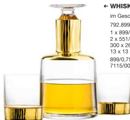
← WHISKY SET im Geschenkkarton / in gift box 792.899.07 1 x 899/0,75 elior gold 2 x 551/14 300 x 265 x 130 mm 13 x 13 x 5.1 899/0,75 elior 7115/004

Weingläser der Serie Elior finden Sie ab Seite 4. Elior wine glasses from page 4.