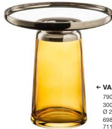
← VASE 790.698.31 300 mm / 11.8 in Ø 290 mm / 11.4 in 698/30 amber 7119/004