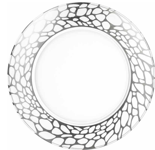
← TELLER PLATE im Geschenkkarton / in gift box 791.516.32 Ø 320 mm / 12.6 in 516/32 net 737/404