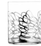
← BECHER TUMBLER 791.569.90 430 ml / 14.5 oz 94 mm / 3.7 in 569/9 net 718/304