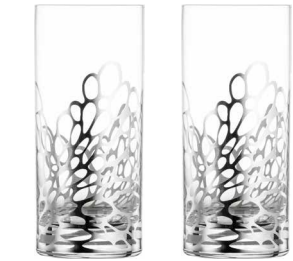
← 2 LONGDRINK GLÄSER 2 LONGDRINKGLASSES in Geschenkröhre / gift tube 791.500.12 470 ml / 15.9 oz 161 mm / 6.3 in 500/13 net GR 737/404