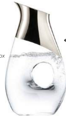
← KRUG JUG

im Geschenkkarton / in gift box NO DROP EFFEKT 301.616.11 1 ltr / 33.8 oz 280 mm / 11 in 616/1,0 lyn platinum 779/004