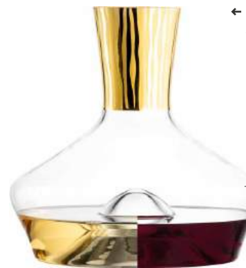
← DEKANTER DECANTER im Geschenkkarton / in gift box NO DROP EFFEKT 792.841.15 1,5 ltr / 50.7 oz 210 mm / 8.3 in 841/1,5 gold 766/004

1,5l 50.7 oz 0,75l 25.04 oz INFO Für 0,75 l und für Magnum geeignet Suitable for both 25.4 oz and a magnum bottle