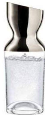
← KARAFFE CARAFE

im Geschenkkarton / in gift box NO DROP EFFEKT 301.843.10 1 ltr / 33.8 oz 280 mm / 11 in 843/1,0 lyn 733/504